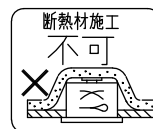
住宅以外の断熱施工天井でご使用の場合の施工方法